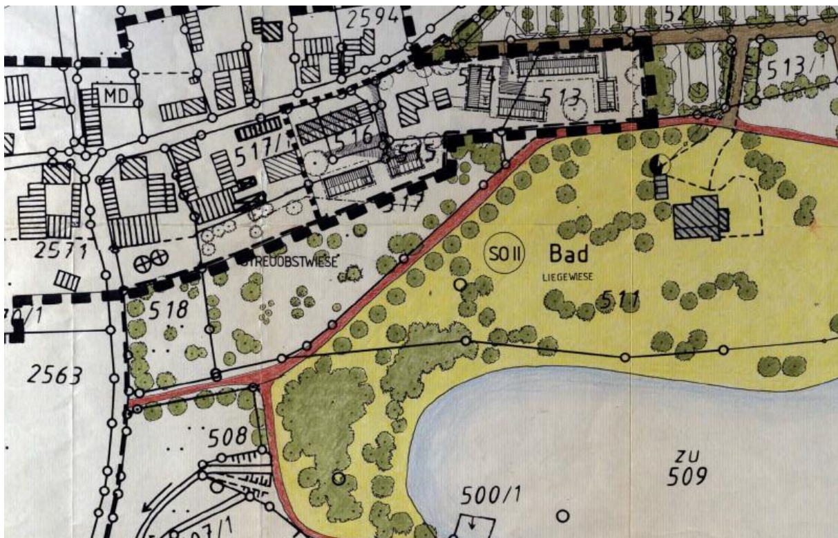
Abbildung 6: Deckblatt Nr. 3 zum BP Rohrbachstausee (ohne Maßstab)

In der Planung des Deckblattes Nr. 3 aus 1994 jedoch wurde der Weg mit Eingrünung so dargestellt, wie er nun auch tatsächlich vor Ort verläuft. Im Rahmen dieser Planung wurde seitens des Planungsbüros eine Streuobstwiese auf Teilflächen der Privatgrundstücke Fl.Nr. 517 und 518 Gem. Eging a.See dargestellt (sh. Abb. 3).