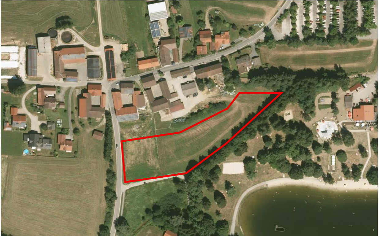
Abbildung 2: Orthophoto 2013 mit Darstellung des Planbereichs