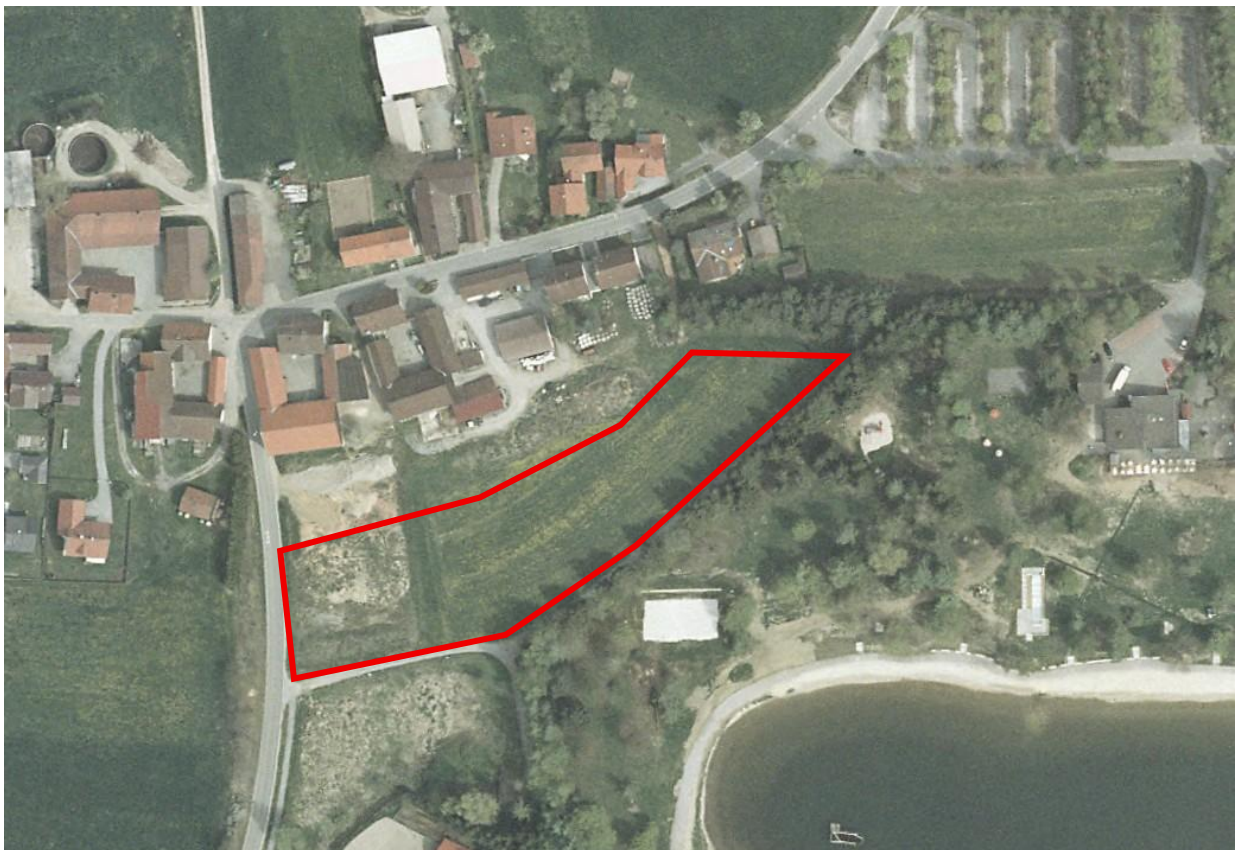
Abbildung 1: Orthophoto 2004 mit Darstellung des Planbereichs

Das Plangebiet wird nachvollziehbar seit mindestens mehr als 20 Jahren intensiv landwirtschaftlich genutzt (Grünland mit Düngung und mehrmaliger Mahd im Jahr – sh. Abb. 1 bis 3). Die Fläche stellt somit keine artenreiche Wiese dar und enthält auch kein Biotop.