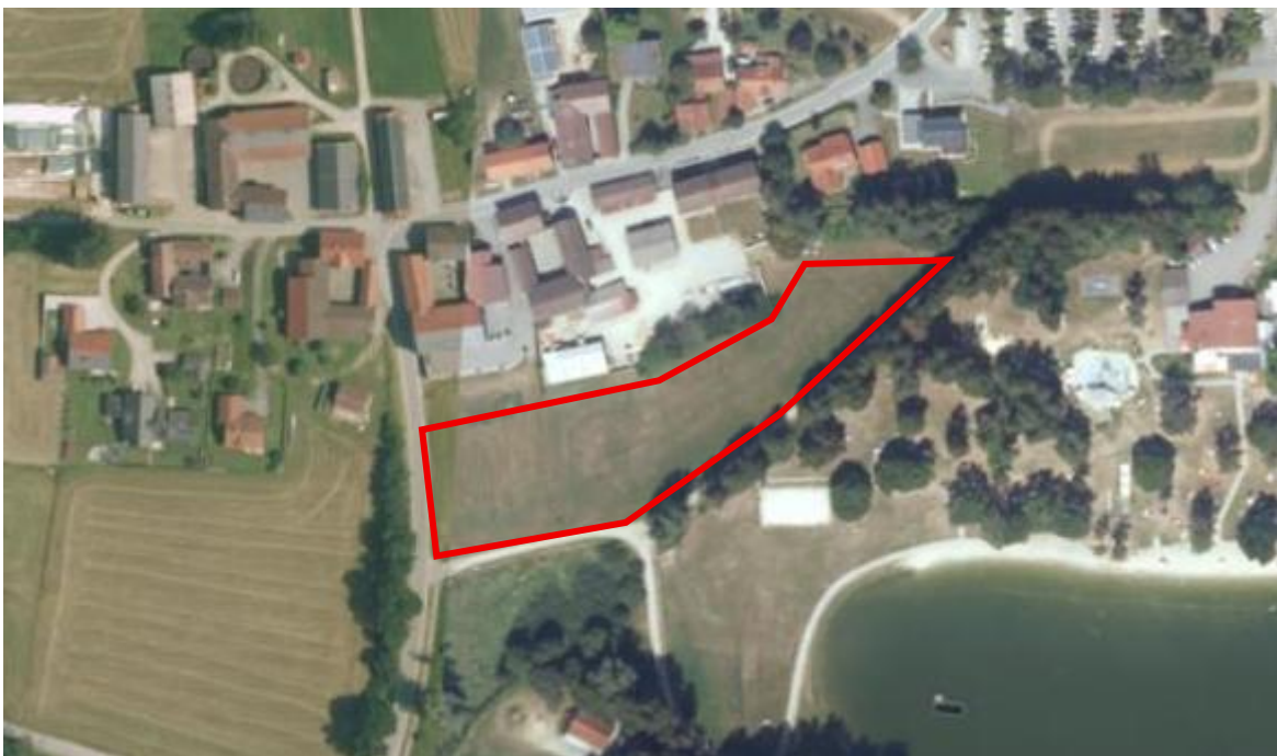
Abbildung 3: Orthophoto 2025 mit Darstellung des Planbereichs