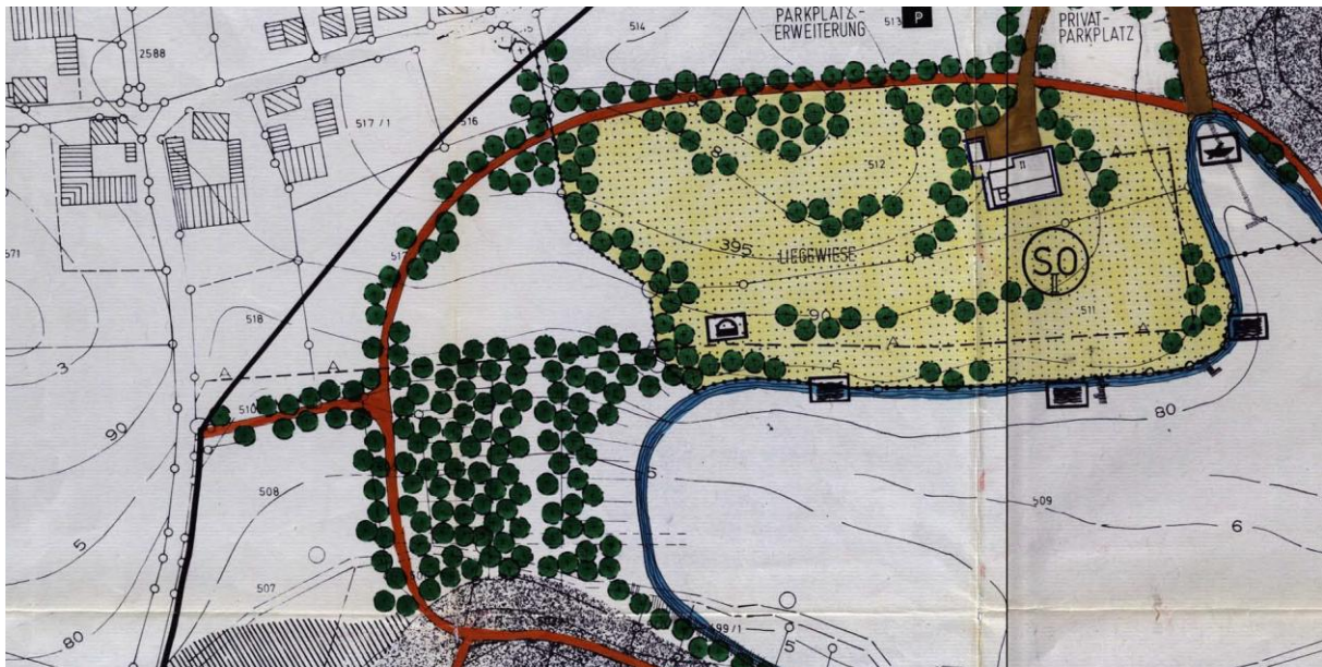
Abbildung 5: Ausschnitt aus Deckblatt Nr. 1 zum BP Rohrbachstausee (ohne Maßstab)

In der Planung des Deckblattes Nr. 3 aus 1994 jedoch wurde der Weg mit Eingrünung so dargestellt, wie er nun auch tatsächlich vor Ort verläuft. Im Rahmen dieser Planung wurde seitens des Planungsbüros eine Streuobstwiese auf Teilflächen der Privatgrundstücke Fl.Nr. 517 und 518 Gem. Eging a.See dargestellt (sh. Abb. 3).