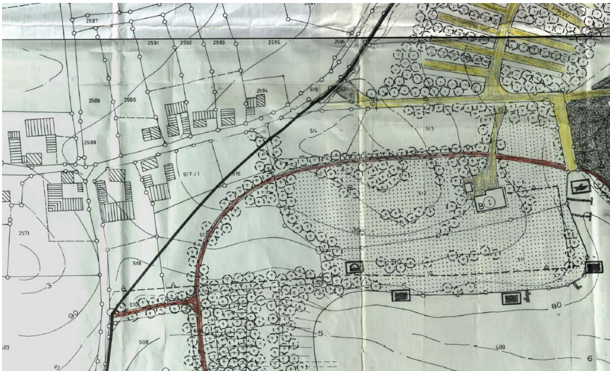
Abbildung 4: Ausschnitt aus dem Ursprungsbebauungsplan (ohne Maßstab)

Im ursprünglichen Bebauungsplan verlief der Rundweg um den See deutlich näher an der Bebauung der Ortschaft Rohrbach vorbei als der Weg, der dann tatsächlich gebaut wurde. Entlang des Weges war zudem dargestellt, dass eine Bepflanzung mit Bäumen und Feldgehölzen zur Abschirmung und Gliederung hergestellt werden muss.