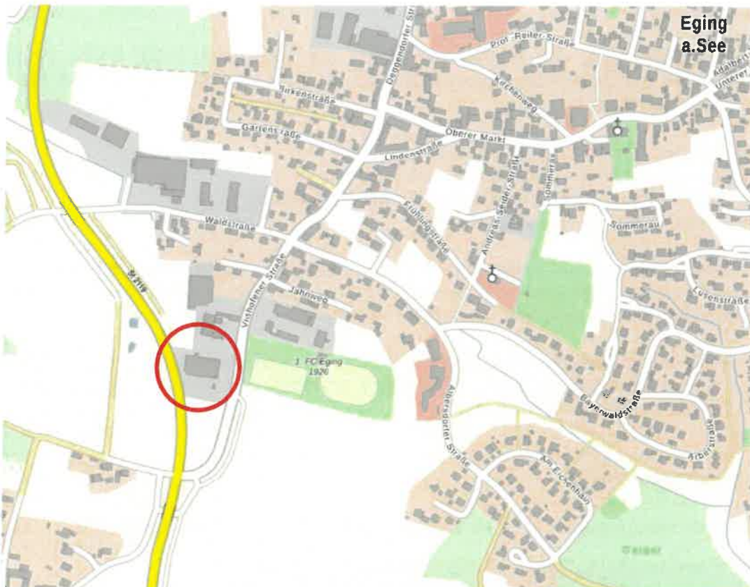
Übersicht (ohne Maßstab)